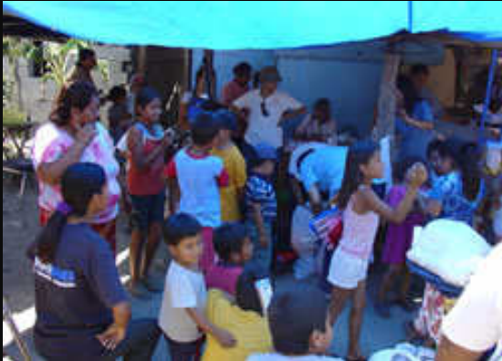
Consultas realizadas en Zona Popular de la Zona Metropolitana de Monterrey, N.L.